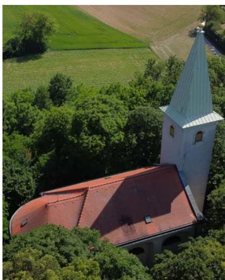
Entwicklungsraum „Um den Heiligen Berg“

Das Pastoralkonzept wird mit 15. Februar fertiggestellt sein und im Anschluss finden Sie es zur Ansicht auf unserer Website www.pfarreladendorf.at bzw. einige Zeit später in gedruckter Form in unseren Kirchen.