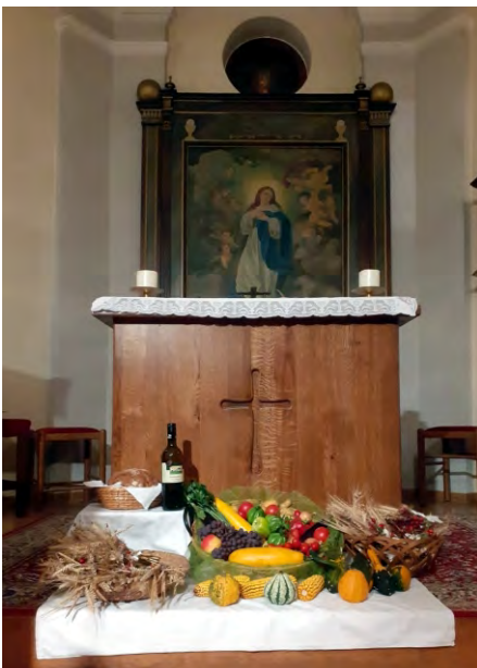
GARMANNS Erntedank

Danach waren alle zu einer kleinen Agape ins Feuerwehrhaus eingeladen. Die FF stellte Aufstrichbrote und Getränke bereit, die Pfarre sorgte für Kaffee und Kuchen.