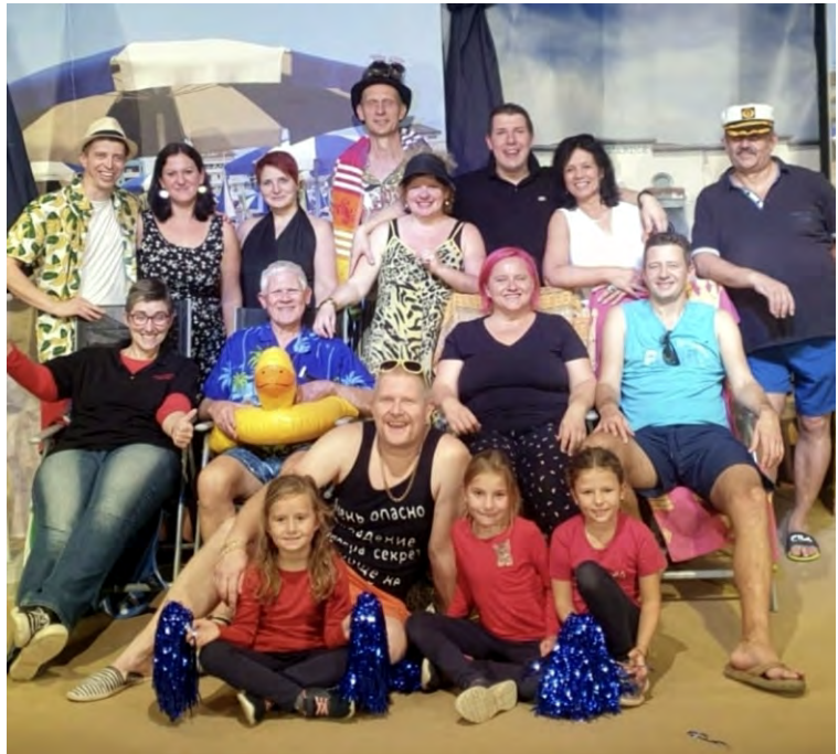
Text und Foto: Elmar Zant, Theatergruppe Ladendorf

Die Theatergruppe Ladendorf bedankt sich herzlich bei allen unseren Gästen und wir freuen uns auf ein Wiedersehen im nächsten Jahr!