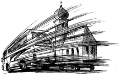
Die Gemeinde unterwegs