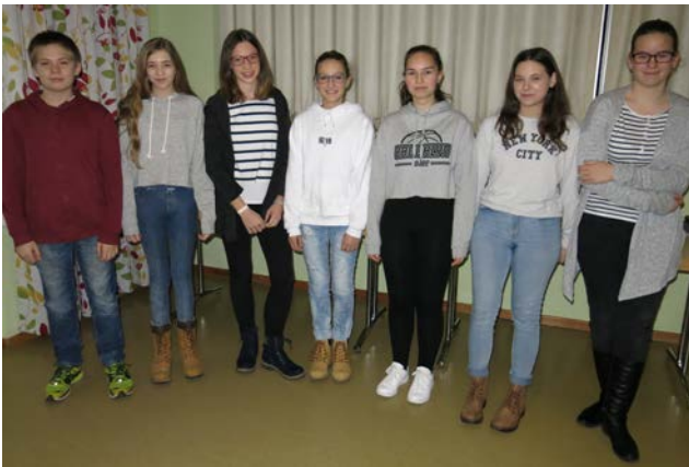
Unsere Firmlinge aus Ladendorf und Garmanns